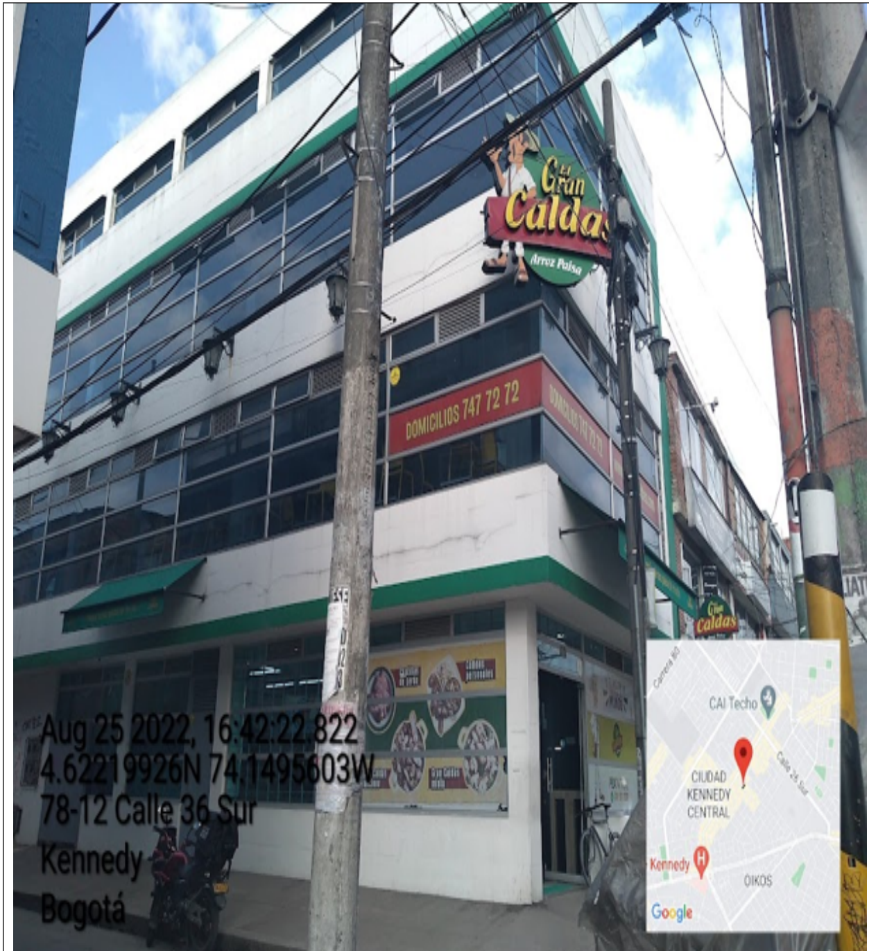
Vista panorámica del predio en el que se sitúa el establecimiento comercial denominado EL GRAN CALDAS ARROZ PAISA , el cual cuenta con fachada con orientación hacia la CL 36 SUR y fachada con orientación hacia la CR 78.