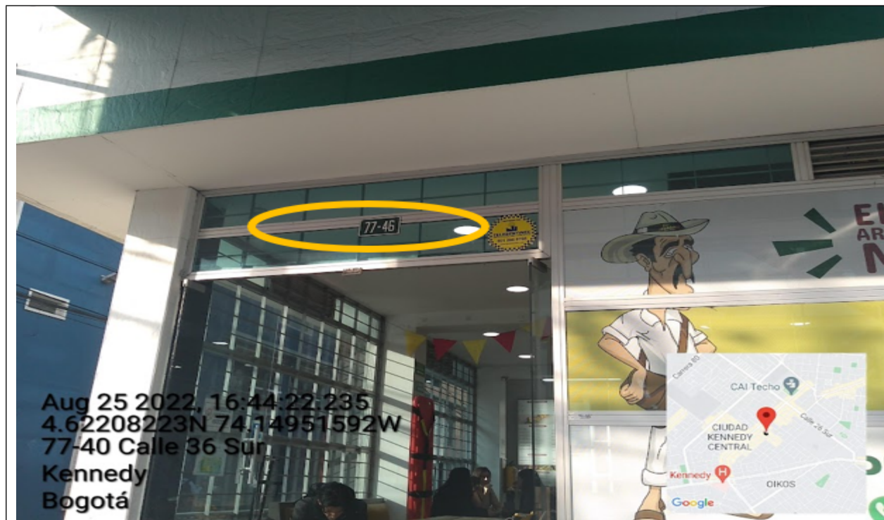
Nomenclatura del predio en el que se sitúa el establecimiento comercial denominado EL GRAN CALDAS ARROZ PAISA , ubicado en la CL 36 SUR No. 77 – 46 .